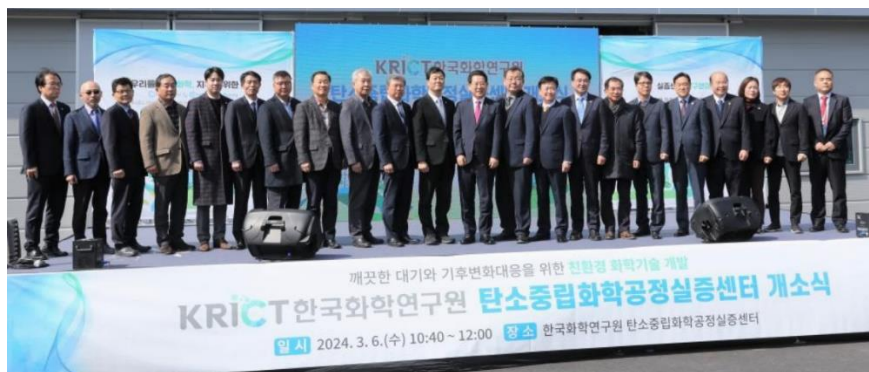
図 4 カーボンニュートラル化学プロセス実証プラントセンター開所式 9

2024 年 3 月、韓国化学研究院は、図 3 に示した韓国南部全羅南道の麗水市にある国家産業団地近くの未来革新地区にカーボンニュートラル化学プロセス実証センターを開所した 8 。