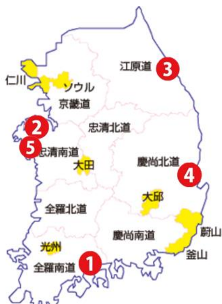
図3 採択された実証サイト5カ所